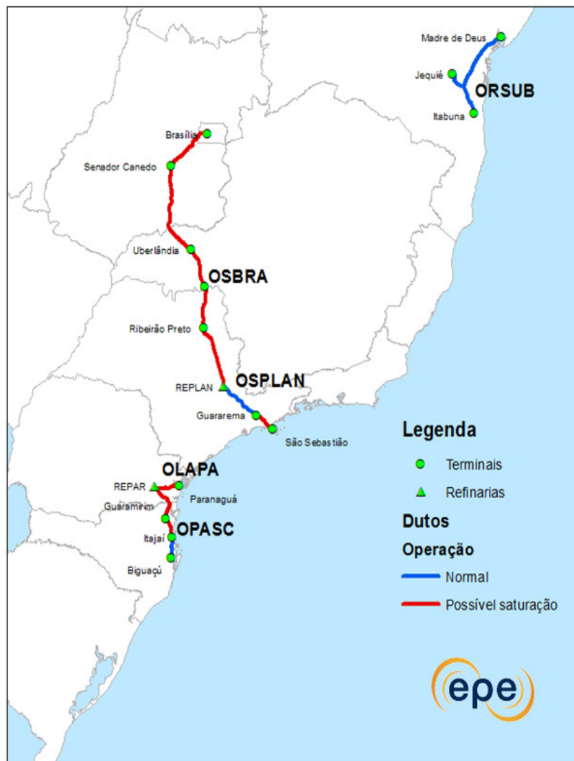
Figura 23. Polidutos de transporte