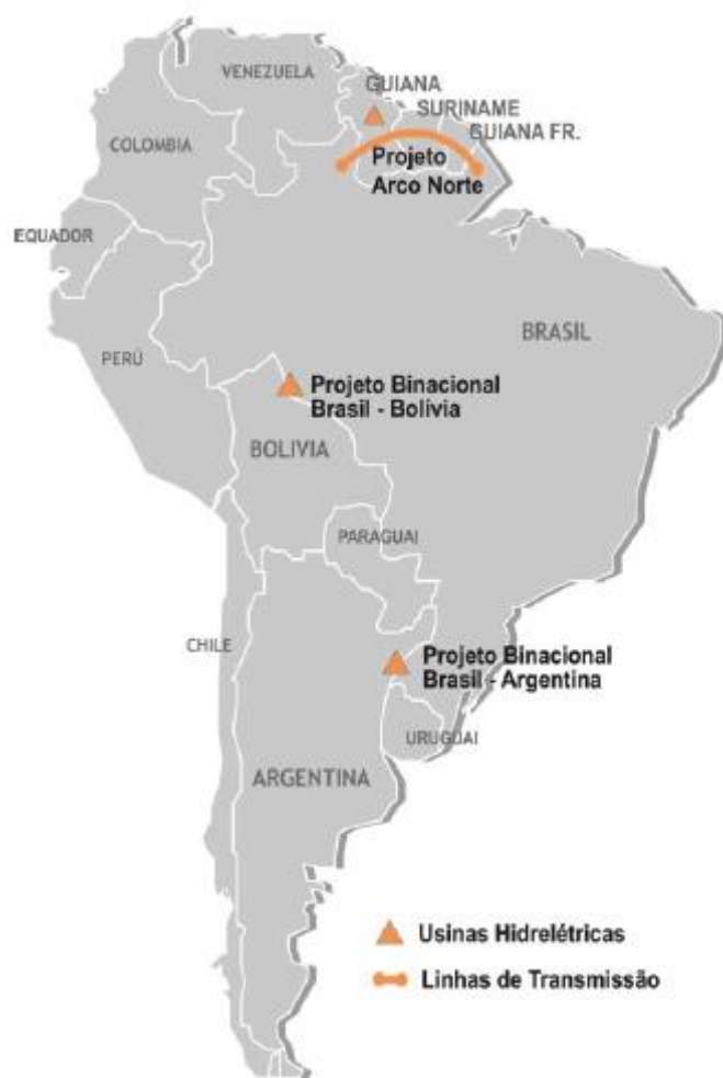
Figura 3. Integração Energética Regional