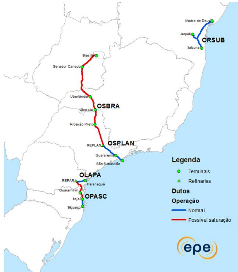
Figura 6-3. - Polidutos de transporte