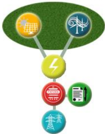
TIPO C - USINAS HÍBRIDAS

Portanto, nessa tipologia o nível de integração das fontes é ainda maior, possibilitando benefícios similares aos dos demais arranjos, potencialmente com uma economia maior. Nesse caso, não haveria o curtailment , pois a limitação já estaria na etapa anterior, de produção de energia elétrica.