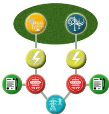
TIPO A - USINAS ADJACENTES

Porém, deve-se atentar para a possível interferência de uma usina na outra. Por exemplo, ao se instalar uma usina fotovoltaica próxima a uma eólica, a sombra das torres e/ou das pás sobre os módulos fotovoltaicos pode provocar perdas, e ainda, o sistema fotovoltaico pode interferir na rugosidade do terreno, possivelmente perturbando o recurso eólico disponível para os aerogeradores.