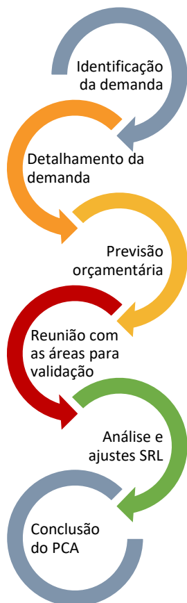
Figura 1 Metodologia aplicada no processo